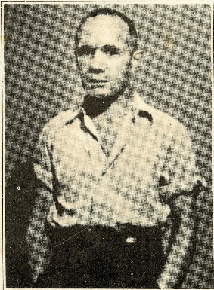
Jean Genet, 1955.

1923: La consagración del Perú al Corazón de Jesús Stevenson y el caos nuestro de cada día Versadas y cadereos en la cumana ¿Mariátegui marxista leninista?